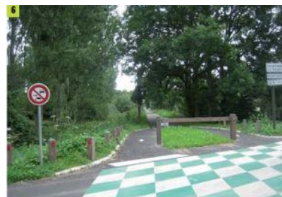
Exemple de marquage au sol