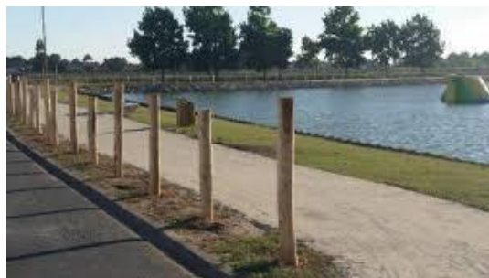
Exemples de bordure aménagée