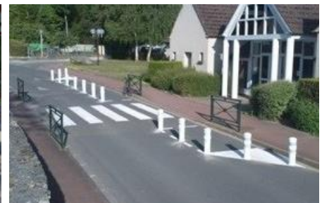
Exemples de chicane couplées à des voies piétonnes / cyclistes